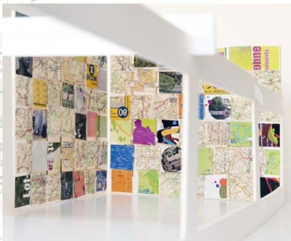
prise de vue d'une maquette, simulation de la structure portique.

- l'autre salle (200 m 2 environ) recevra prioritairement sculptures et installations.